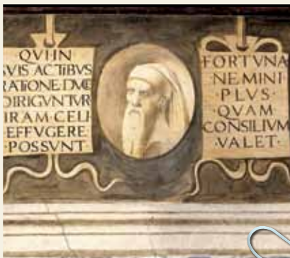
FREGIO GIORGIONE EST PRIMA PARTE - (particolare)

Accanto alla sua storia secolare, che ha origine alla fine del XII secolo, con l'edificazione della cinta muraria, la città custodisce leggende e misteri che accompagnano la vita della città nelle varie epoche. Il castello è stato oggetto di conquista, assedio, sopralluoghi strategici da parte di illustri condottieri: aneddoti documentati e in parte tramandati nella memoria collettiva, come la visita dell'imperatore Federico II che, salito sulla torre di nord est, scrutando la configurazione degli astri, sembra avesse da lì predetto il successo della sua prossima campagna militare. La città è anche identificata come luogo di nascita del celebre pittore Giorgione, i cui dipinti e vicende biografiche si prestano alle più diverse interpretazioni. La tradizione ci tramanda l'immagine di un grande artista, ma anche quella di uomo appassionato e favoleggia sulle sue vicende amorose con la bella Cecilia, che ci aspetta in una piazza del centro storico per raccontarci la sua verità sulla sua discussa relazione con il grande pittore. Tappa finale del percorso è Villa Caprera, l'elegante edificio che avrebbe accolto Giuseppe Garibaldi di passaggio a Castelfranco in una pausa di riposo tra un'avventura e l'altra.